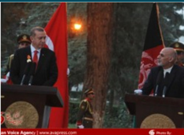
an Voice Agency | www.avpress.com

این کشور ۳۹۳ سرباز در افغانستان دارد، ولی این سربازان شرکت چندانی در میدانهای