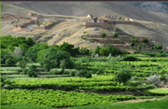
Kandahar exports up to 40,000 tons of grapes this year.

According to the provincial branch of the Afghanistan Chamber of Commerce & Industries (ACCI), up to 40,000 tons of grapes have been exported from southern Kandahar this year.