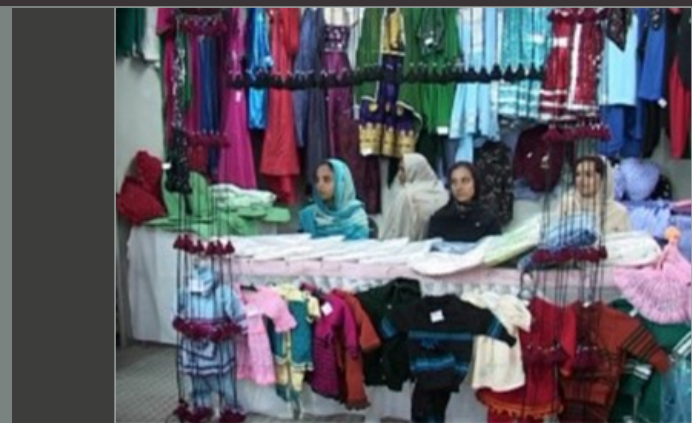
Foreign imports hurting Afghan women's business in Balkh

In the meantime, some exports complained about the border closures inflicting heavy losses, as their products go rotten.