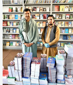
« دفتر انتشارات عازم »