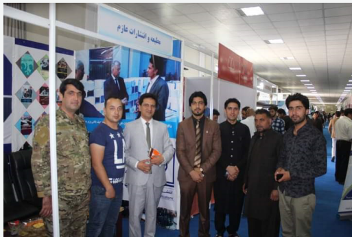
« انتشارات عازم در نمایشگاه کتاب »

تحولات سیاسی اخیر در کشور باعث دلسردی و از بین رفتن بیشترین کار و تجارت های کوچک و بزرگ گردید که انتشارات عازم هم در پی راهی این صنعت بود ولی کار هایی بنیادی و ساختار مآبانه برای بهبود و تحول در نسل جوان این سرزمین عازم را واداشت تا ادامه دهد و امیدی برای فردهای بهتر برای مردم و جوانان داشته باشد که البته اقبال عازم از کارهای بنیادی این انتشارات چنین روایت دارد، " عازم اولین انتشارات بنیانگذار نشر و بخش میباشد، باعث تشویق نویسندگی و هنر نویسندگی گردیده، روزانه تولید 5000 جلد کتاب دارد سالانه به میلیون ها جلد کتاب در داخل و خارج از کشور به فروش می رساند. " وی از ابتکارات خودش در زمینه پرودکشن عازم میگوید که در کنار انتشارات عازم در بخش آموزش مضامین ساینسی به شکل تصویری در افغانستان فعالیت می نماید.