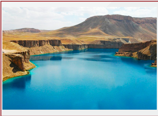
” بند امير، باميان، افغانستان “

په افغانستان کې د يوې ښځې لپاره يو گام پورته کول دومره ستونزمن او سترې کوونکی دی لکه د يوې لوړې څوکي ته پورته کيدل، خو ناشوني نه دی.