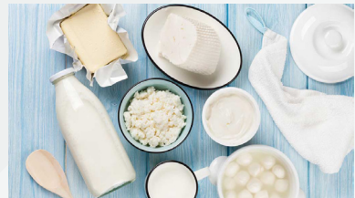
” محصولات شرکت زراعتی و مالداري روزنه سعادت “

گام برداشتن برای یک زن در افغانستان به مانند فتح یک قله بلند مشکل و طاقت فرسا است ولی ناممکن نیست، "تو میتوانی، تو قدرتمند هستی دایما جمله های بوده که مرا تشویق و ترغیب نمودن تا گام های عملی برای آرزو هایم بردارم و نخستین هدف برایم رشد و ارتقای ظرفیت زنان از لحاظ مالی بود که توانستم با راه اندازی شرکت لبنیات روزنه سعادت در بخش مالداري و زراعت آنرا محقق نمایم، همچنان پیدا کردن زنانی که از درس و تحصیل باز ماندن معرفی آنها به انستیتوت ها برای ادامه تحصیل و فردای بهتر کشور و جامعه افغانستان، گام های دیگری بودن که مشتاقانه طی کردم." در جامعه افغانی بخاطر رسوم و عنعنات قبیله ای و بومی بیشترین تعداد خشونت ها در برابر زنان صورت میگیرد و یگانه راه برای آگاه سازی از عان عامه مردم و بخصوص زنان برای حق و حقوق تعلیم و تحصیل آنها میباشد.