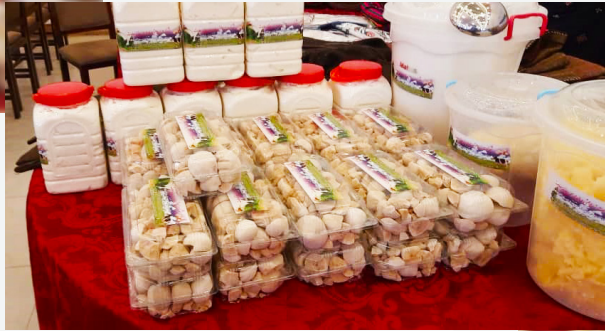
” محصولات شرکت زراعتی و مالداري روزنه سعادت “